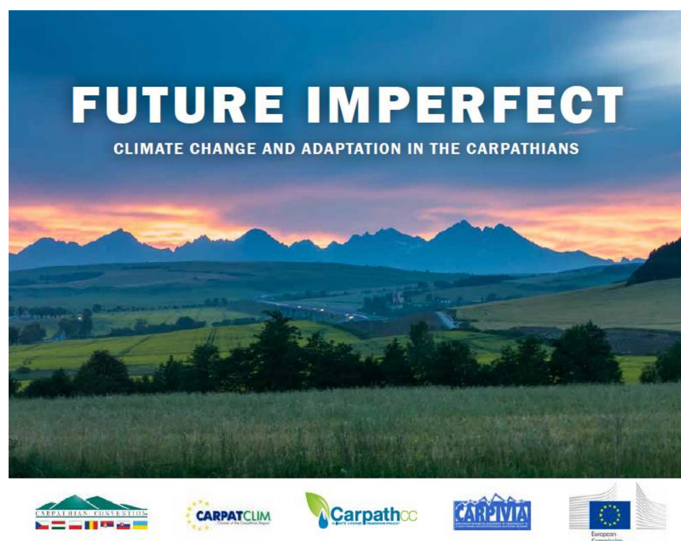
A Kárpátok éghajlatával foglalkozó projektek eredményeit bemutató népszerűsítő kiadvány (UNEP, 2014)