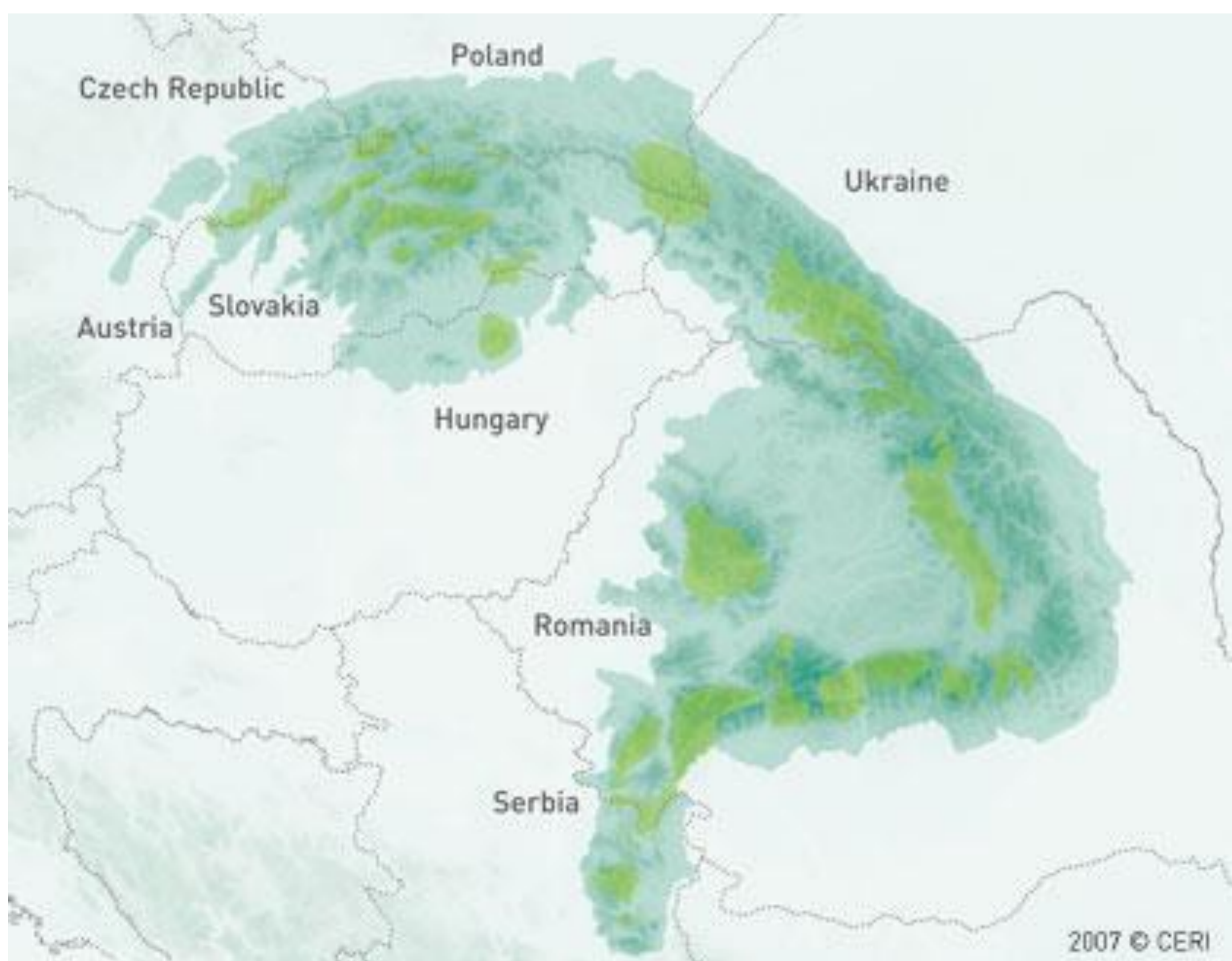
A Kárpát Régió területe

A Kárpát Régió védelme és fenntartható fejlődése